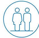
Vertreter*innen des Allgemeinen Universitätspersonals

Der AKGleich repräsentiert alle Universitätsangehörigen und wird in einem ausgewogenen Verhältnis von Personen aller Kurien aus allen Fakultäten bzw. Zentren zusammengesetzt.