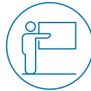
Vertreter*innen der Universitätsdozent*innen sowie der wissenschaftlichen Mitarbeiter*innen im Forschungs- und Lehrbetrieb