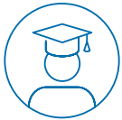
Vertreter*innen der Studierenden

Alle Mitglieder sind weisungsfrei und unabhängig und werden nach ihrer Erfahrung und ihrer Kompetenz in gleichbehandlungs- und frauenfördernden Belangen ausgewählt. Mindestens die Hälfte der Mitglieder sind Frauen.