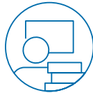
Vertreter*innen der Universitätsprofessor*innen